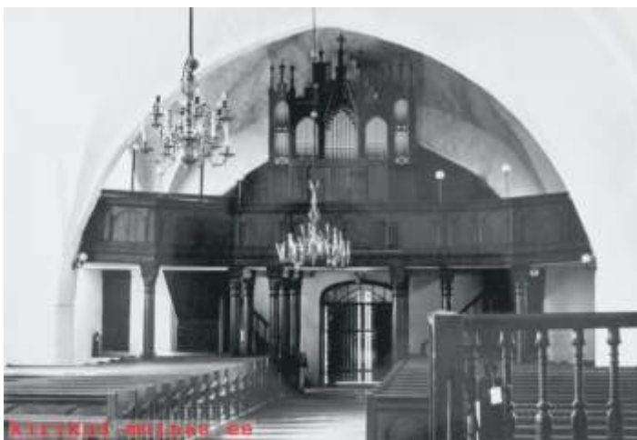
KRIISADE OREL