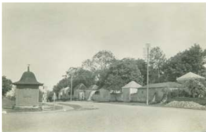
FOTO: KOPLI KALMISTU OMA ROHKETE KABELITEGA OLII EESTI ÜKS UHKEMAID NEKROPOLE, NÄITAB 1925. AASTAL TEHTUD FOTO.