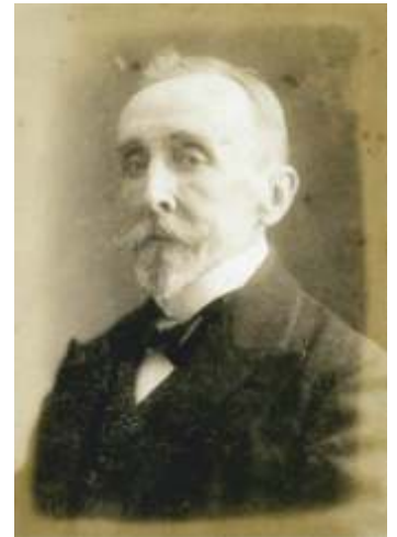
KUNSTNIK VON LIPHART

Jõhvi 1943.a. sündmused olid jätnud tööle tõsised, ehkki mitte tulekeeltest tekitatud märgid. Kogu tööd katva aukartust äratava tumenenud lakikorra ning mustusekihi kõrval olid silmatorkavaimaks kahjustusteks just väljalõikamisest tekkinud rebendid, mis olid koonduvad Kristuse näo ning ülakeha piirkonda ehk alale, kuhu vaataja pilk esmalt maali vaadates suundub. Tollast sündmuste kulgu ette kujutades vajas kolme meetri kõrgune maal väljalõikamise käigus alla, mitte ei keeratud seda