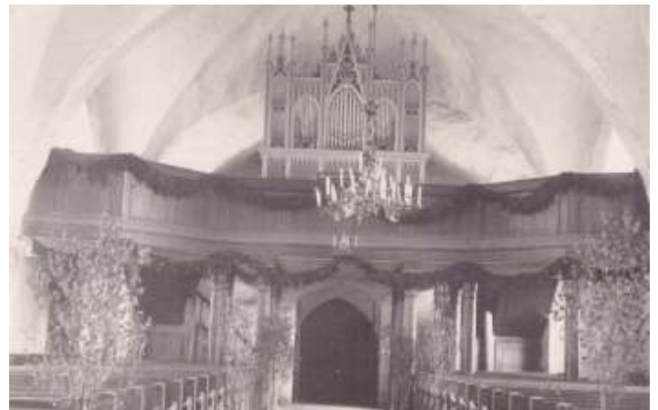
NORMANNI OREL JÕHVI MIHKLI KIRIKUS.